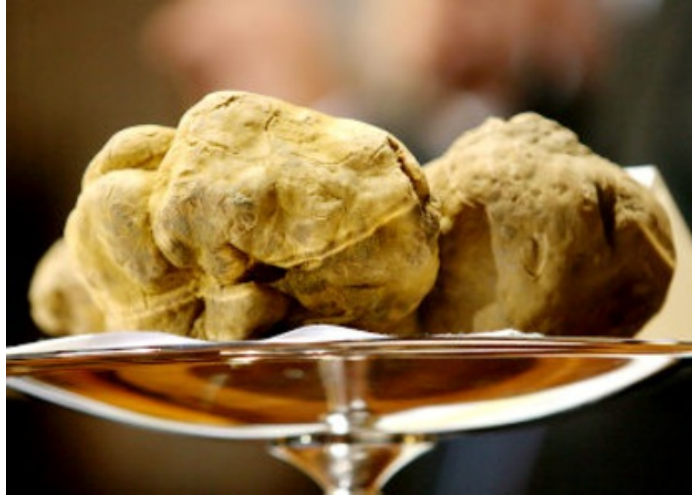
Tartufo Bianco Pregiato